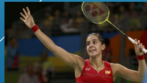
Carolina MARIN (ESP) – Simple Dame - N°1 Mondiale (meilleur classement) – Championne Olympique (1) / du Monde (3) / D'Europe (7)