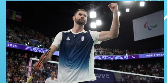
Lucas MAZUR (FRA) – Simple Homme handisport – Double Champion Paralympic